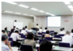
社員ボランティアを対象とした講師養成講座

2008年度は、本社・事業所がある地域を中心に、全国各地で講座を開催。また、事前に開催された講師養成講座には多数の社員が参加し、講師として必要な知識・ノウハウ