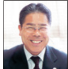
江東区立深川第五中学校 校長

当校においても、生徒を対象とした「インターネットの利用」に関する教室開催などを積極的に進めています。今後も、近隣地域にICT企業があるという特色を活かし、地域と連携しながら、情報化社会における“学校としての社会的責任”を果たしていきたいと考えています。