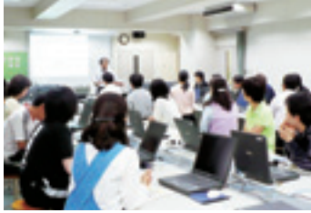
深川第五中学校で開催された「e-ネット安心講座」

そうしたなか、「e-ネットキャラバン」を通じ、当校の近隣に本社がある日本ユニシスの講師の方に当校教師を対象とした講座を実施していただき、インターネットサイトが持つさまざまな“光と影”につ