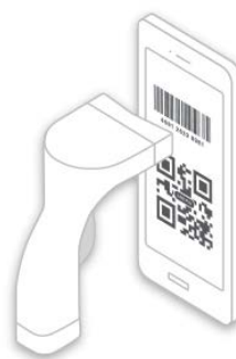
3 レジに提示して読み取り