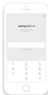
2 パスワードを入力してコードを表示