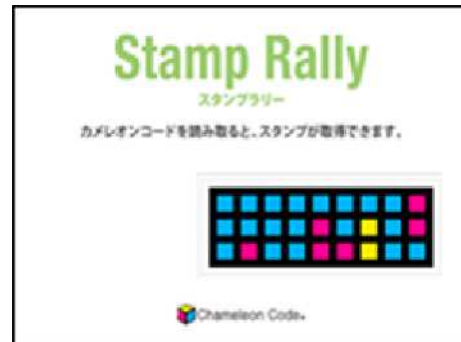
(ブースに掲示されるカメレオンコード)