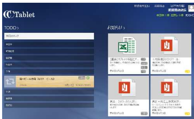
（検証中の CoreCenter Tablet 画面イメージ）