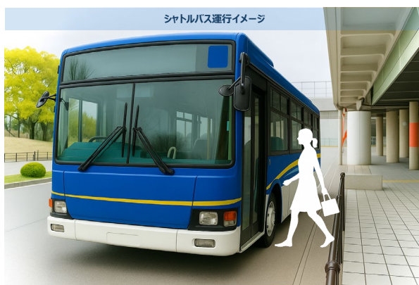
※画像はバス運行のイメージであり実物のバス車両と発着場とは異なります。