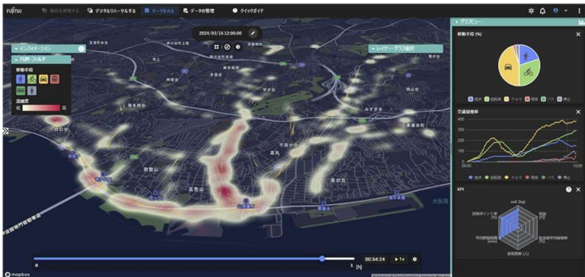
富士通株式会社による神戸市垂水地区のソーシャルデジタルツインシミュレーションイメージ

神戸市は富士通株式会社の協力のもと、神戸市内の道路運行状況を分析し、混雑緩和効果の高い経路を推定しました。さらに同社の社会課題を起点とする事業モデル「Uvance」から提供するソーシャルデジタルツインの技術を活用したシミュレーションにより、最適なシャトルバス運行施策等を検討していきます。