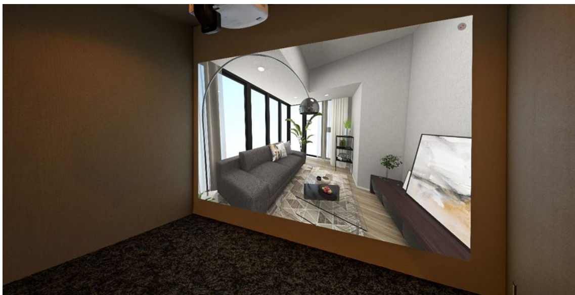
ブランズ南草津マンションギャラリー VR シアター ※提携家具コーディネートはリビング・ダイニングと一部の居室のみ

9月18日より「ブランズシティ南草津」マンションギャラリーでは、全51タイプ VR モデルルームを約2.8m×1.9mの大画面シアターで公開。4K 画像でよりリアルな体感をお楽しみいただけます。