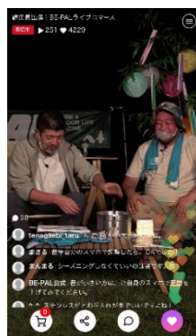
ライブ配信の様子