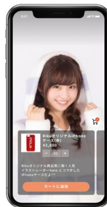
ライブ画面上で購入