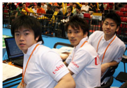
スコア入力をサポートした日本ユニシスの選手たち