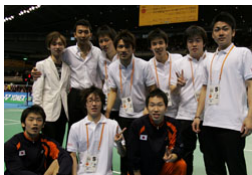
歌い終わって日本ユニシス選手たちと